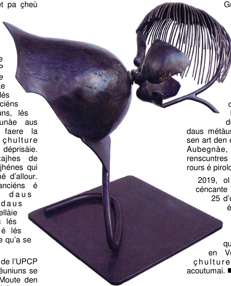
Viérjhe é l'enfant pr le pirolour su métàu Guy Mallard.

2019, ol étét l'annàie daus cécante ans de l'UPCP. Le 25 d'octobre, La Soulière é lés parçouneries de l'UPCP en Vendàie avant velu prchantèe çhàu qu'avét amenai l'UPCP en Vendàie é sortir la çhulture dau folcllore acoutumai. ■