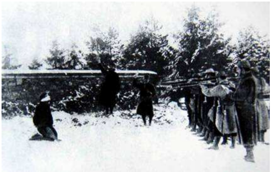
Fousellai pr l'exenpille