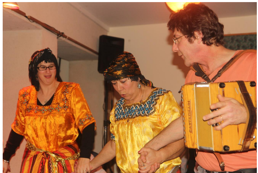
Le semadi 9 de novenbre 2013, den le mitan dau Féstivàu dçtounne en Vendàie, ol oghut ine renscontre entr la parçounerie Alfa de La Roche-su-Yun, qui agroue daus Cabiles en France é pi La Soulaere. Ol at chantai en parlanjhe é en tamazigh. Ol at maelai lés musiques é lés dances !