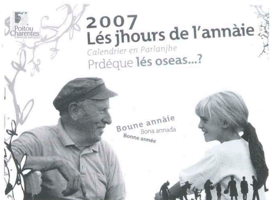
Calende fét pr la Réjhiun Poetou-Chérentes